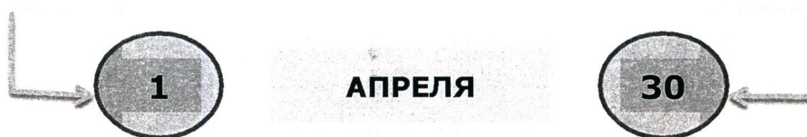
Схема 1. Представление сведений

федеральные государственные служащие, служащие ЦБ РФ, работники ПФР, ФСС РФ, Федерального фонда ОМС, государственных корпораций и др.