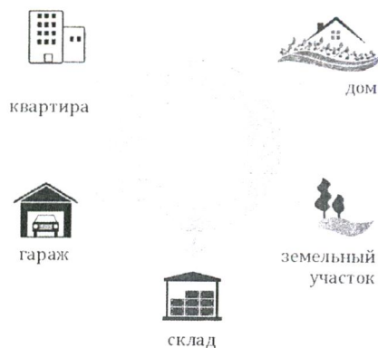
Схема 2. Недвижимое имущество

в) дачный земельный участок - земельный участок, предоставленный гражданину или приобретенный им в целях отдыха (с правом возведения жилого строения без права регистрации проживания в нем или жилого дома с правом регистрации проживания в нем и хозяйственных строений и сооружений, а также с правом выращивания плодовых, ягодных, овощных, бахчевых или иных сельскохозяйственных культур и картофеля).